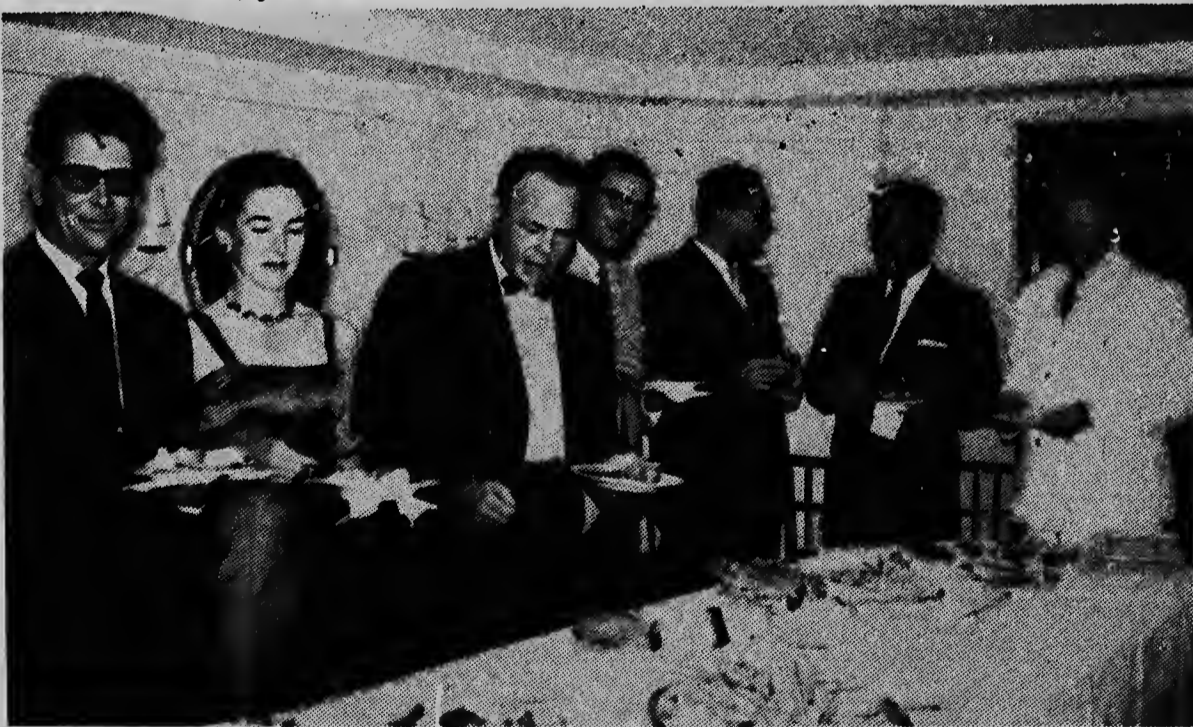
Diabierna anochi riba invitacion di Aruba Trading Company un cocktail party a worde teni aborbo di "Hornstern" di Horn Line, un compania di navegacion Aleman, cual for di Hamburg via Rotterdam, Antwerpen, Le Havre, Aruba y haafnan na Venezuela, Colombia, Costa Rica y E.U. ta bolbe Hamburg. Desde medio 1963 Horn Line ta bishitando Aruba arobe regularmente. Como cu desde e tempo ey carga pa y for di Aruba ta aumentando mensualmente y A.T.C. representante di e compania aki na Aruba ta mira porvenir di Horn Line na Aruba yen di speranza, a dicidi di invita e fiel usadonan di e compania aki na e isla pa un hospitalidad na bordo di un di e bunita baporanan di e linea. Diabierna anochi esaki y a tuma lugar. Algun ora sumamente agradable cu bebidanan bon prepara y cuminda frui delicioso e invitadonan a pasa na bordo di "Hornstern". Y pues esey tabata e proposito di A.T.C. Ariba e foto nos ta mira e invitadonan di A.T.C. representantenan di A.T.C., e.o. e manager Sr. Leonard (di cuatro di drechi) y ass manager Sr. Kuiperi (di dos di drechi) na e mesa cu platonan delicioso.